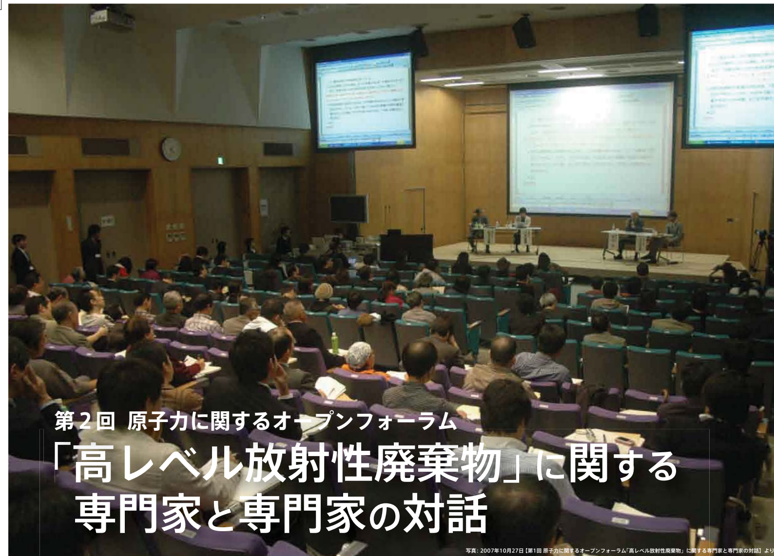
写真：2007年10月27日【第1回 原子力に関するオープンフォーラム「高レベル放射性廃棄物」に関する専門家と専門家の対話】より